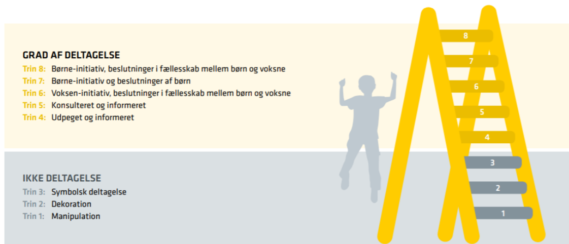
Figur 1: Harts deltagelsesstige

Roger Hart præsenterede i 1992 'The ladder of children's participation' (Hart, 1992). Harts deltagelsesstige har været den mest udbredte og mest indflydelsesrige model for børn og unges deltagelse (Hart, 2008; Shier, 2001). Harts deltagelsesstige bygger videre på Sherry Arnsteins deltagelsesstige fra 1969, der niveauinddeler voksnes deltagelse ud fra et demokratisk medborgerskabsideal (Arnstein, 1969). Harts børnedeltagelsesstige har otte trin og niveauinddeler involveringen af børn, i forhold til i hvilken grad de er med til at understøtte en ligeværdig inddragelse i principielt alle aspekter af livet og samfundet (Hart, 1992; Warming, 2011a).