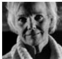
KAREN JESPERSEN Velfærdsminister