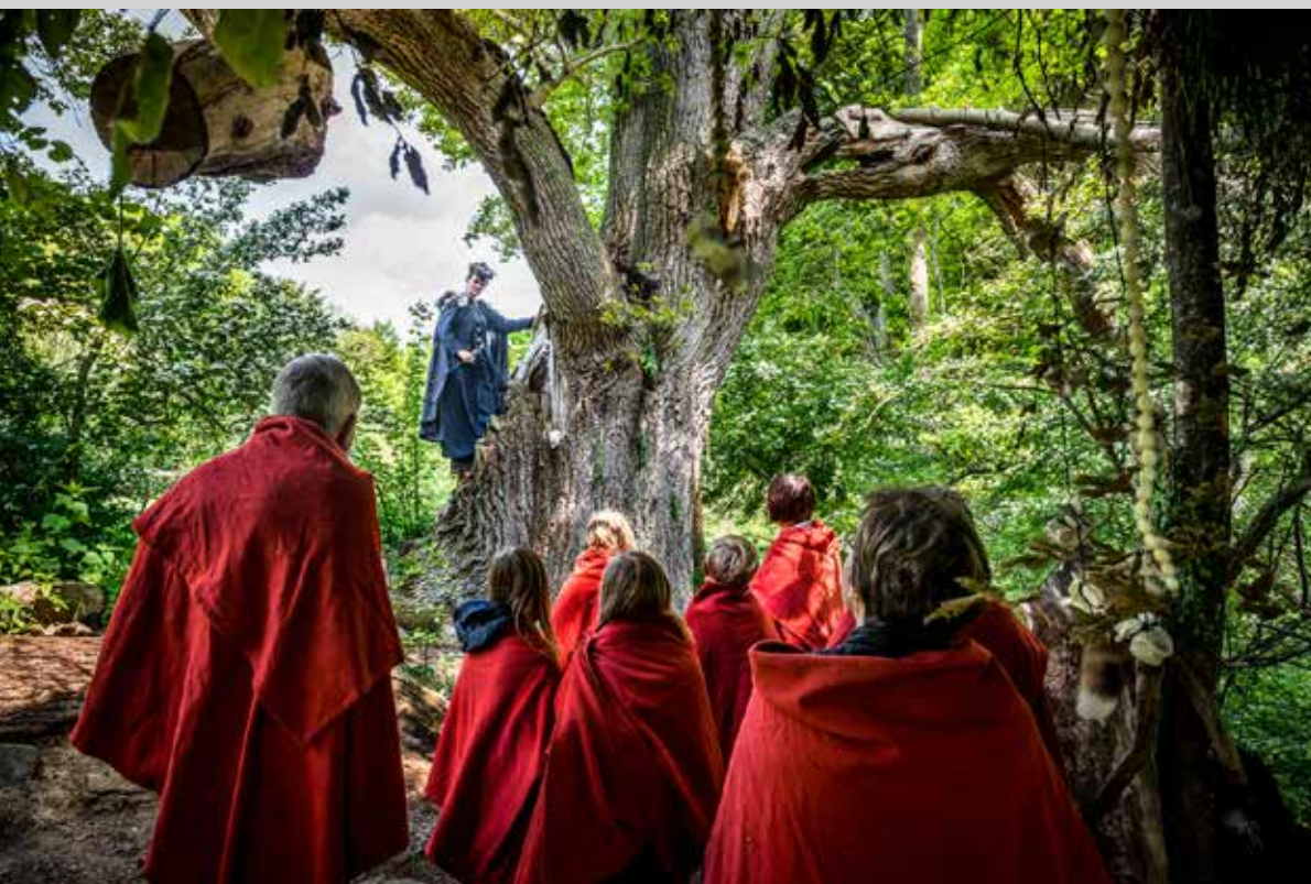
Orms Rejse / Moesgaard Museum