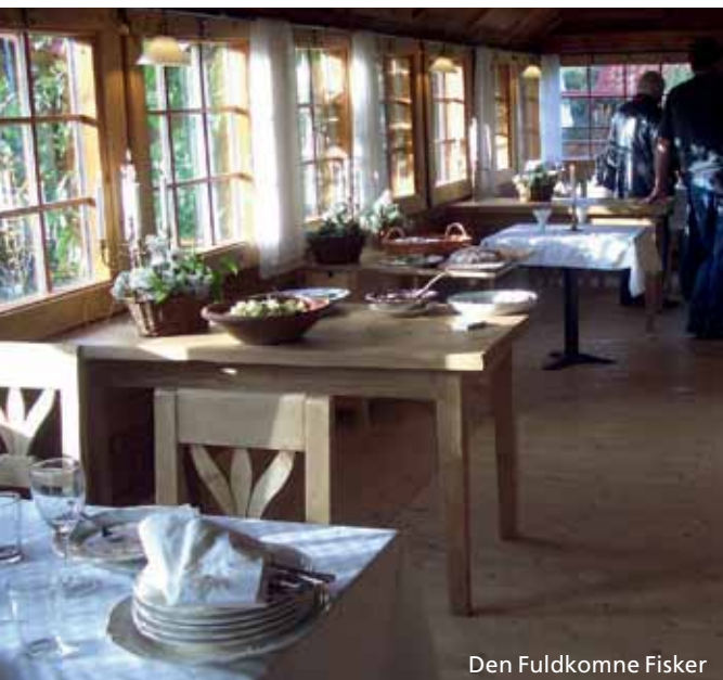
Den Fuldkomne Fisker

Oppe på nordspidsen af Lolland har man den herligste udsigt til Vindeby Havmøllepark, der leverer vedvarende energi til øen.