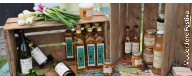
Moder Jord Festival

Søerne omkring byen er en spadseretur værdig, turen kan også gøres på cykel, og samtidig kan man se det fine gamle frilandsmuseum , der ligger ved Søndersøs nordlige bred. I en weekend midt i juni arrangerer museet en stor fødevarerfestival – Moder Jord – med temaer som frugt & sundhed for hele familien, frugtcirkus med børneaktiviteter og et stort marked med kød, pølser, oste, frisk frugt og grøntsager, most, frugtbrændevin m.m. Museets gamle bygninger danner en spektakulær ramme omkring de udstillede fødevarer.