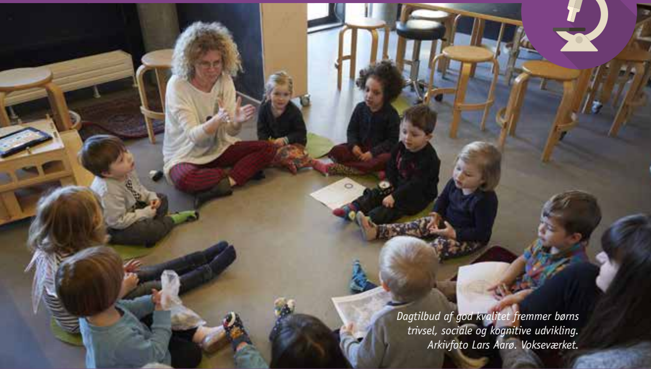
Dagtilbud af god kvalitet fremmer børns trivsel, sociale og kognitive udvikling. Vokseværket.