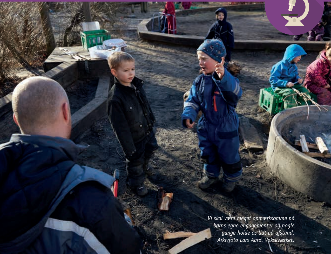
Vi skal være meget opmærksomme på børns egne engagementer og nogle gange holde os lidt på afstand. Vokseværket.