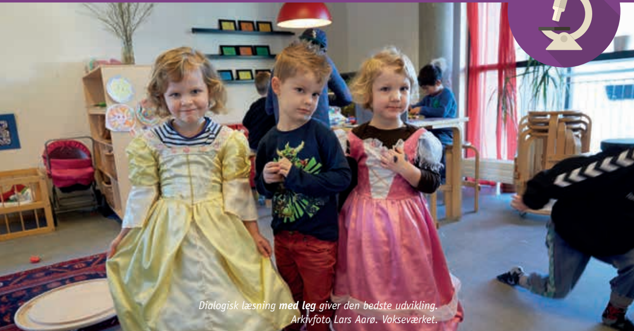
Dialogisk læsning med leg giver den bedste udvikling. Vokseværket.