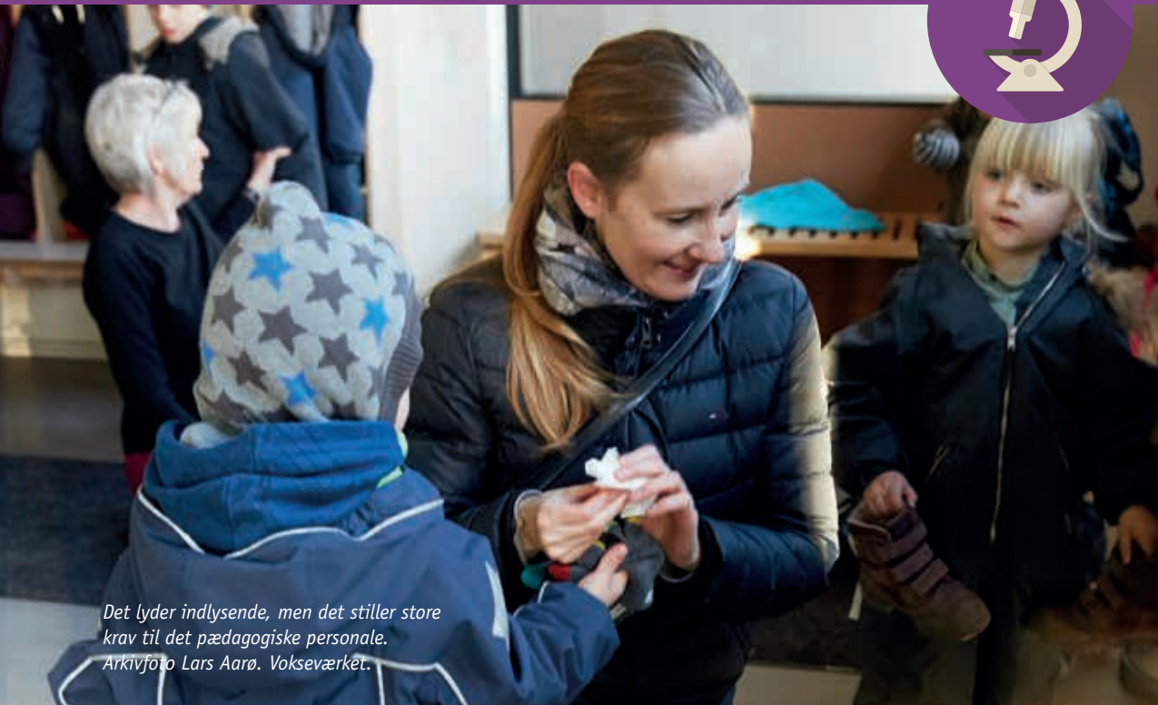
Det lyder indlysende, men det stiller store krav til det pædagogiske personale. Vokseværket.