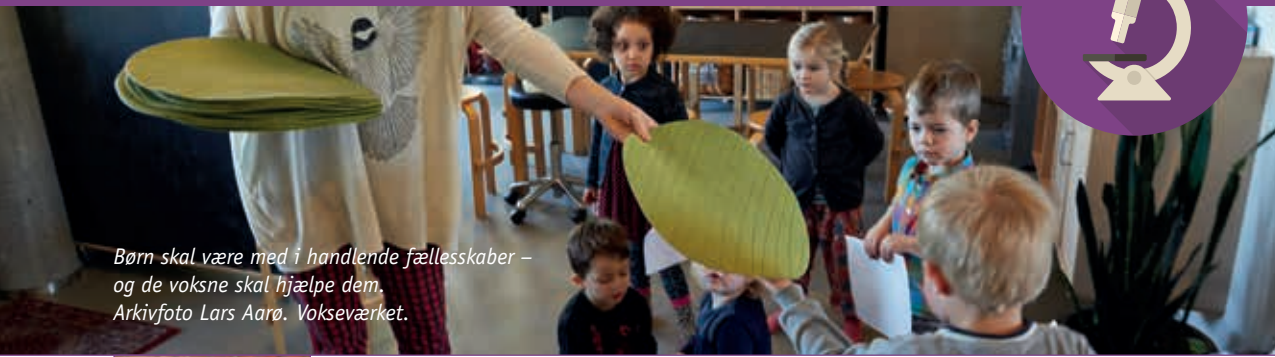
Børn skal være med i handlende fællesskaber – og de voksne skal hjælpe dem. Vokseværket.