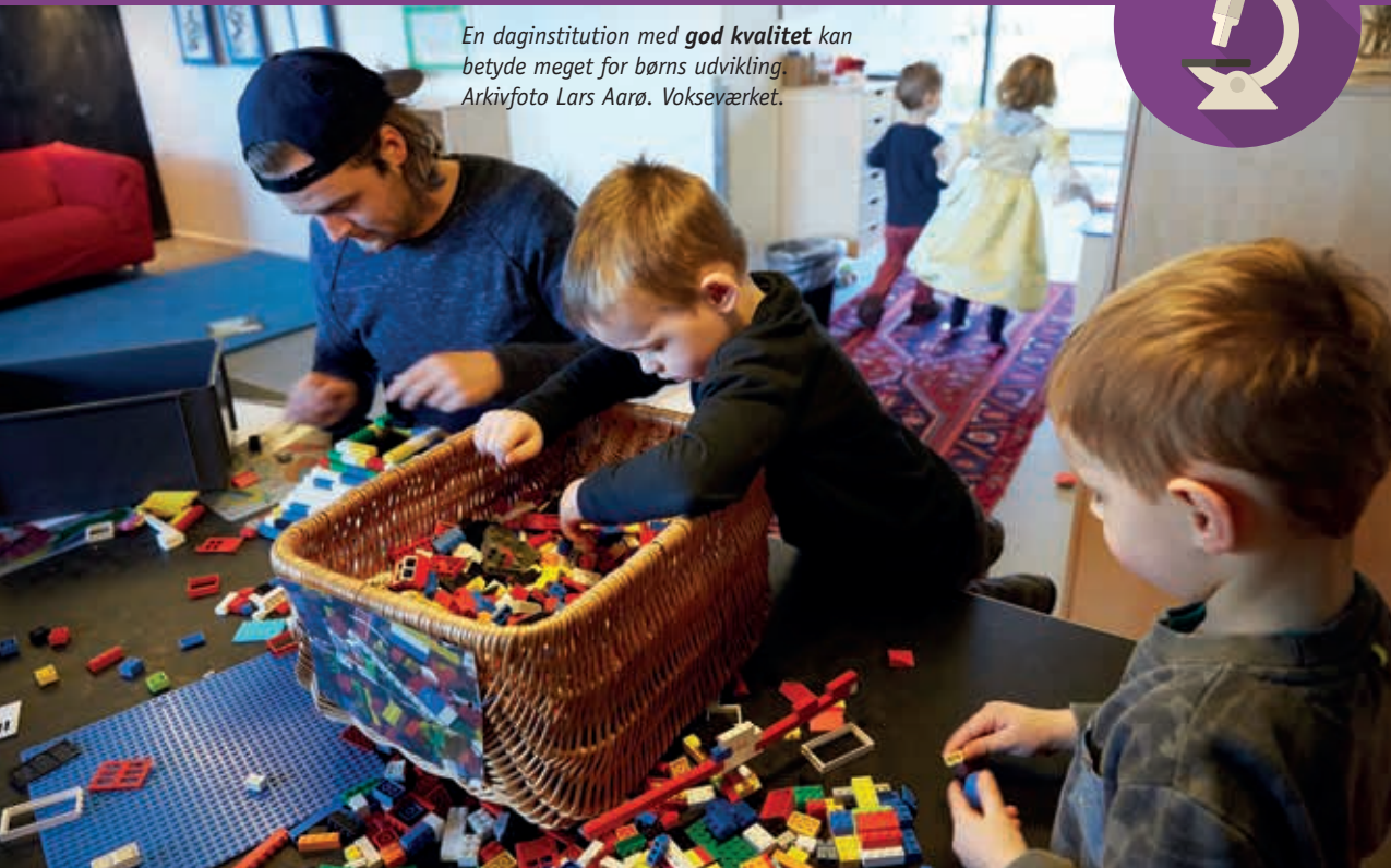
En daginstitution med god kvalitet kan betyde meget for børns udvikling. Vokseværket.