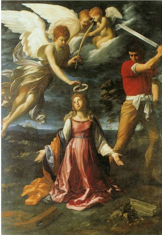
Guido Reno, Il martirio di Santa Catarina d'Alessandria. Museo Diocesano, Albenga.

helligånden som due lukker udblikket. Til illustration følger her et maleri af Guido Reni. 37 38