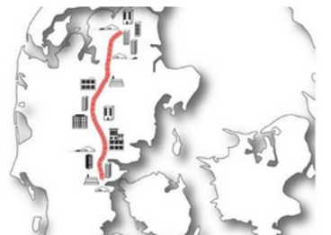
Vækst og varige job i Hærvejsmotorvejen