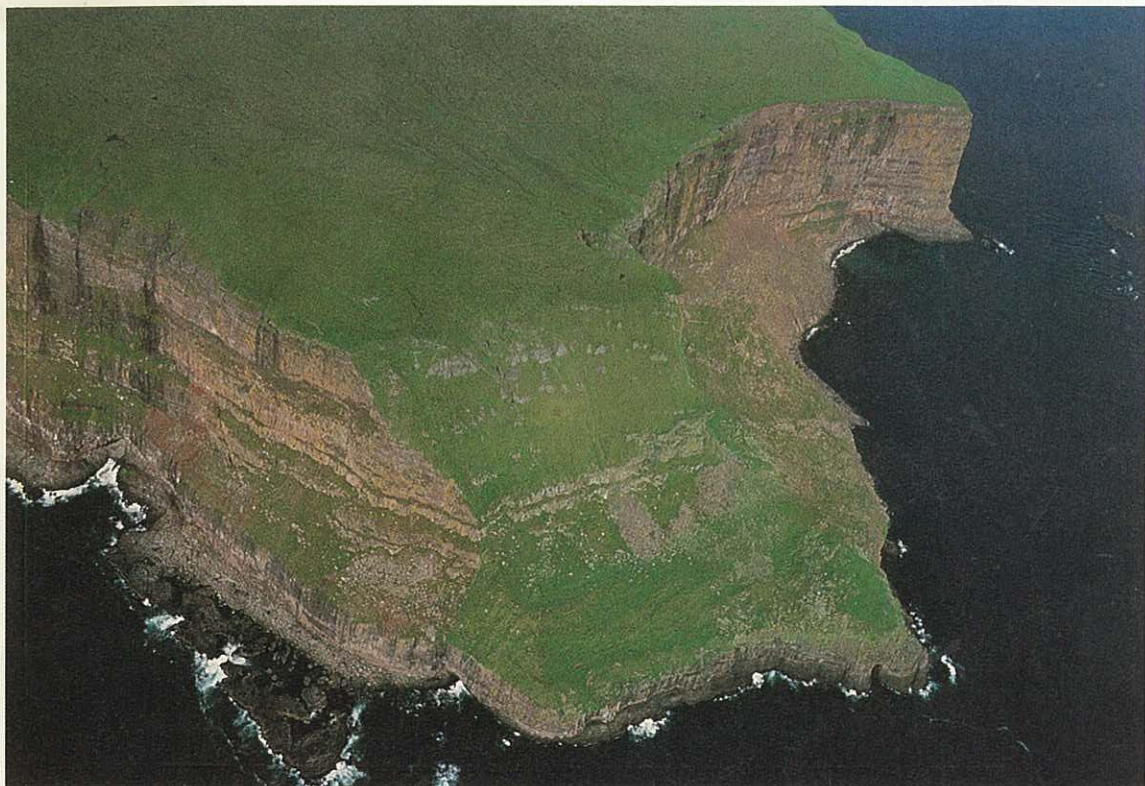
Fig. 11. Sydspidsen af Sandoy. Produktiviteten af udmarken (dvs. slagte- og uldudbytte pr. hektar) veksler meget fra område til område. Sydspidsen er et feitilendi – et afsides område, fysisk adskilt fra de øvrige hauger, hvor produktiviteten er 3-4 gange så høj som i resten af området. Dette har flere årsager: Området er sydvendt med stor solindstråling, der forøges ved refleksion fra havet. Opvarmning af fjeldet bidrager til et særligt mikroklima, som de lokale indbyggere berømmer. Jordlaget er tykkere end andre steder, og en stabil vandtilførsel ovenfra hindrer udtørring, samtidig med at dræningen er god. Vigtigst er dog nok, at området er tæt besat af søfugle, hvis gødning falder overalt, og derved giver jorden den næringstilførsel som tydeligvis mangler mange andre steder i udmarken.

Vanskelighederne øgedes, da det begyndte at blive almindeligt at dyrke kartofler på Færøerne. Kartoffelavl kunne give et stort udbytte år efter år på samme lille jordstykke, ofte dårlig sandjord, blot der blev gødet tilstrækkeligt, f.eks. med tang. Kartofflen var altså velegnet for småbonden. Men den gav problemer, fordi vintergræsningsrettighederne til bøen var baseret på at sommerens høst kunne overstå inden 22. oktober. Men kartoflerne blev liggende i jorden. Fårene gik ofte i bedene, og det var forbudt at indhegne om vinteren. Til gengæld kom kartofflen til at passe fint ind i fiskeriets sæsoner, og kunne dermed bidrage til at holde skibsejernes udgifter til lønninger nede.