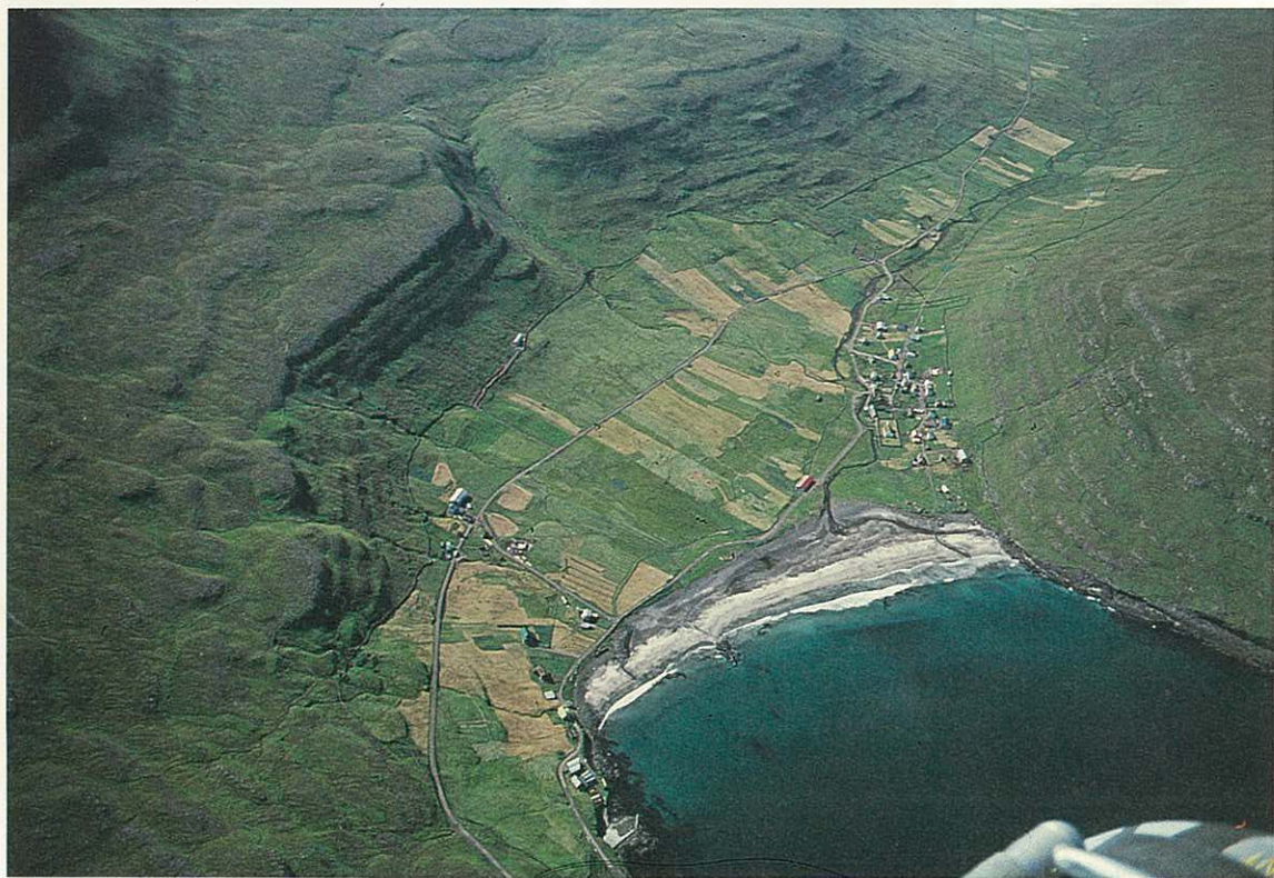
Fig. 7. Bygden Húsavík på Sandoy. En nærmere beskrivelse af bygden findes i »topografisk Atlas Danmark«. En beskrivelse af fårebruget findes i »Om økologi«. En beskrivelse af bygdens økonomiske forhold findes i »Noget om bygden Húsavík«. Se litteraturlisten.

Samtidig betød netop monopolhandelen, at forbindelsen til omverdenen ganske kanaliseredes gennem denne, idet det var forbudt at handle med fremmede. En sådan handel var dog gangse udbredt, når man