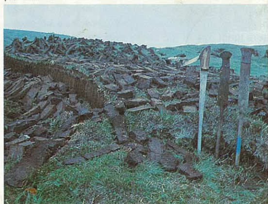
Fig. 10. Tørveskær. Ved siden af er placeret forskellige spader, der anvendes indenfor det færøske landbrug.

Da eksportprisen på strømper og trøjer steg i 1700-tallet, fik man vanskeligheder, fordi de besiddelsesløse kunne tjene en større dagløn ved at strikke, end de fik ved at arbejde som tjenestefolk på gårdene. Det eneste, der krævedes, var uld og et par strikkepinde. I den anledning blev der vedtaget en lov, der forbød unge mennesker at gifte sig, hvis de ikke havde lovligt erhverv eller havde tjent mindst 5 år som tjenestefolk på en gård. Som lovligt erhverv regnedes naturligvis ikke tilvirkning af hoser og trøjer. På den måde søgte man at fastholde den billige arbejdskraft på landet. Det lykkedes også delvis i perioden indtil det færøske fiskeri for alvor kom igang. De fattiges indtjening ved selvstændigt fiskeri holdtes også i ave ved hjælp af en lov, der tillod de rige bønder at udskrive folk til bemanning af deres både til forårsfiskeriet.