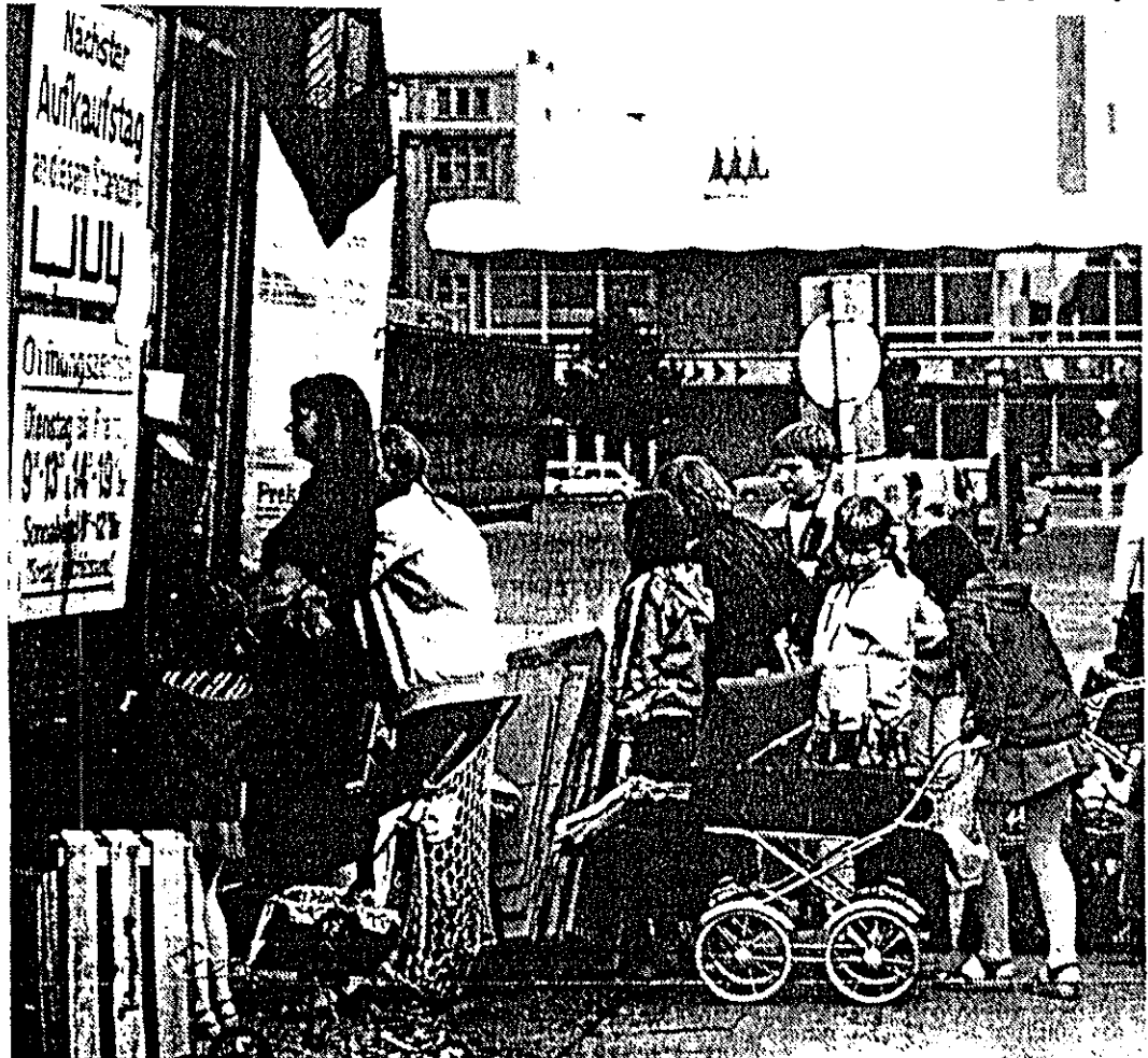
Lederen af DDRs genbrugs-kombinatet oplyste i sidste måned, at der alene fra DDRs husholdninger i perioden 1981-85 kom genbrugsmaterialer til en værdi af en milliard mark. Der gennemføres intensive kampagner i boligområderne for at få indsamlet genbrugsmaterialer. Billedet er fra en sådan kampagne i Berlin.