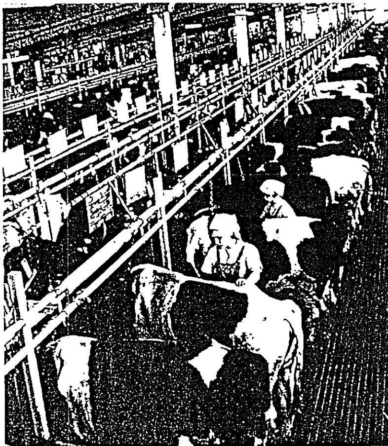
I 60'erne byggedes meget store stalde uden specielle tanke til gylle. Og gylleproblemerne, har siden tårnet sig op. Sprøjtemidler, gødning siver ud i søerne, der har vigtige rekreative og vandøkonomiske funktioner.