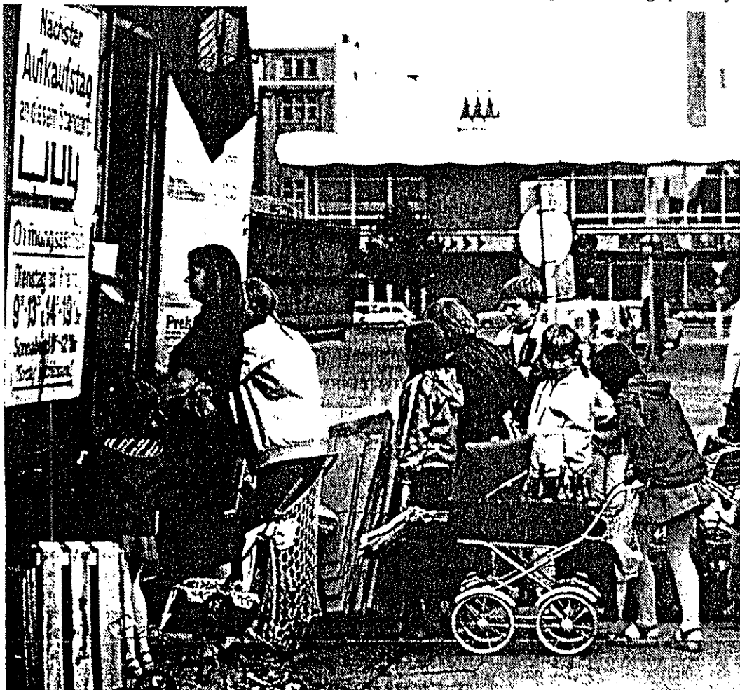
Lederen af DDRs genbrugs-kombinatet oplyste i sidste måned, at der alene fra DDRs husholdninger i perioden 1981-85 kom genbrugsmaterialer til en værdi af en milliard mark. Der gennemføres intensive kampagner i boligområderne for at få indsamlet genbrugsmaterialer. Billedet er fra en sådan kampagne i Berlin.