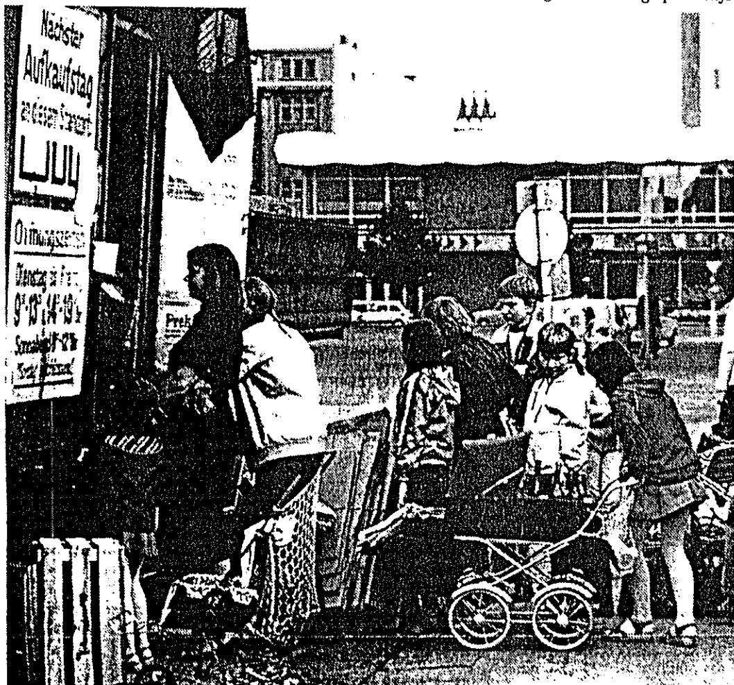
Lederen af DDRs genbrugs-kombinatet oplyste i sidste måned, at der alene fra DDRs husholdninger i perioden 1981-85 kom genbrugsmaterialer til en værdi af en milliard mark. Der gennemføres intensive kampagner i boligområderne for at få indsamlet genbrugsmaterialer. Billedet er fra en sådan kampagne i Berlin.