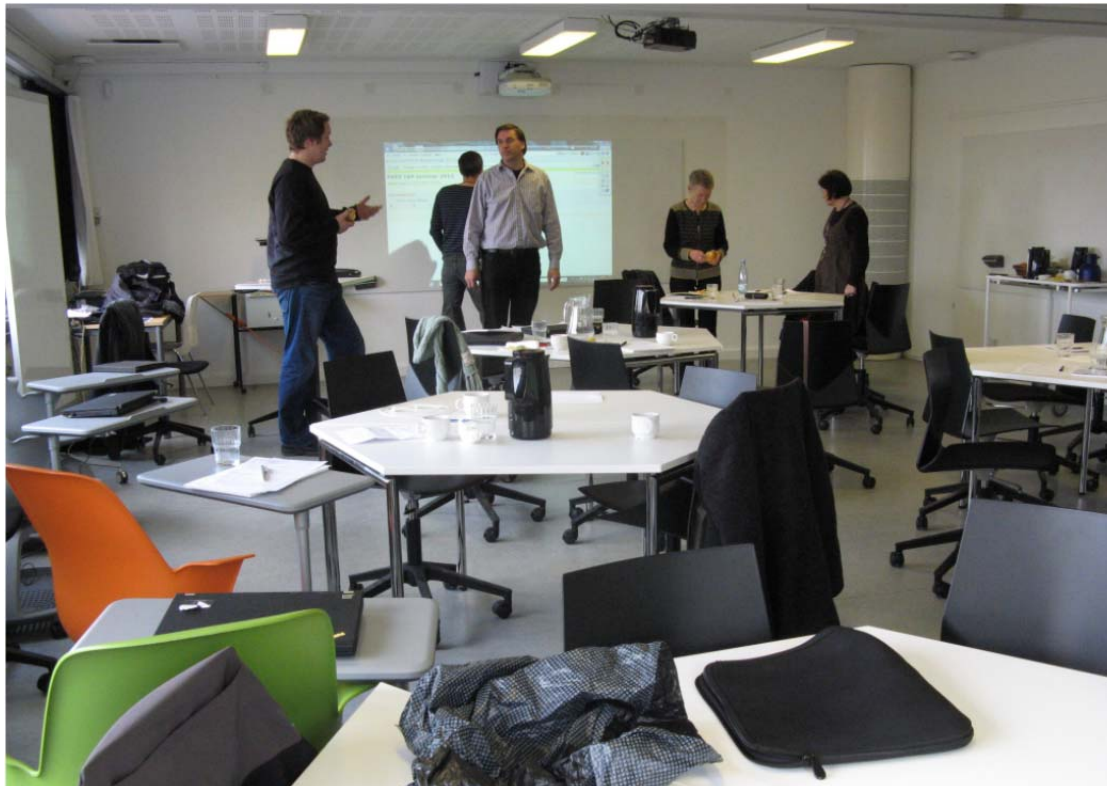
Inventar i Kollaboratoriet