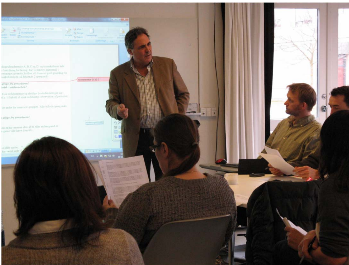
Gruppearbejde i Kollaboratoriet

Der har været gennemført observationer og evalueringer af al skemalagt undervisning. Observationerne er foretaget dels af projektet selv, dels af et forskningsprojekt inden for psykologi, og dels af repræsentanter fra Bygningsstyrelsen. Evalueringerne har inddraget både undervisere og studerende. Efter afslutningen af forårets skemalagte undervisningsaktiviteter har der været gennemført et fællesmøde for alle involverede for at opsamle og dele erfaringer. Observationer og evalueringer fortsætter i efteråret 2012 og formodes at munde ud i et par videnskabelige publikationer, bl.a. et bidrag til et temanummer i tidsskriftet Læring og Medier om innovative undervisningsmiljøer.