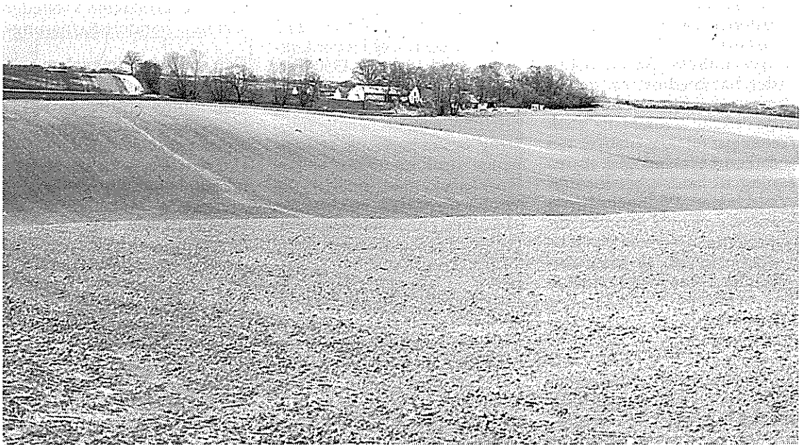
Pløjemark ved Slæggerup syd for Gundsø (ca. 25 ha). Et eksempel på stor kontrast mellem arealanvendelse og landskabsstruktur. Vil det også være hensigtsmæssigt i fremtiden, hvor der vil blive stillet større krav til sædskifte, grønne marker, sikring af biotopstruktur, beskyttelse af vandressourcer og flersidig – herunder rekreativ – anvendelse af landskabet?