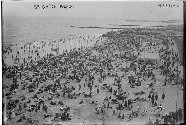
Brighton Beach, Brooklyn, New York, 1905.