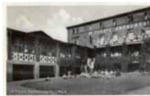
Flindts Badehotel i Lohals, 1932.

ralinden, som hun kender fra København og siger til hende, mens hun ser på de dansende: "Hvor det egentlig er underligt at sidde og se paa alle de Mennesker, som ikke hører os til, det er dog altid som at være paa Komædie."