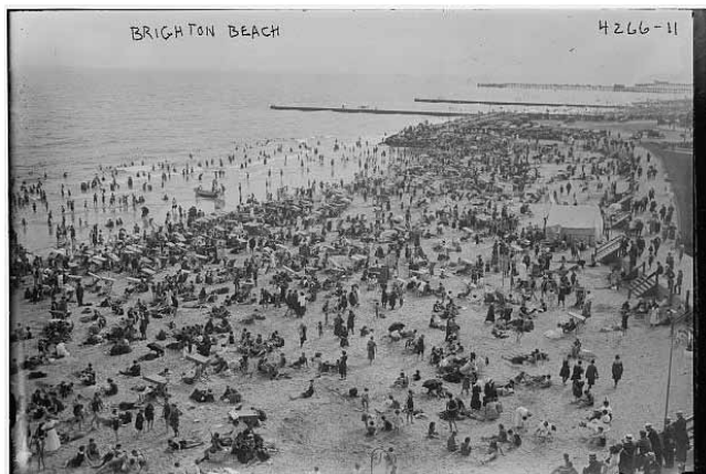
Brighton Beach, Brooklyn, New York, 1905.