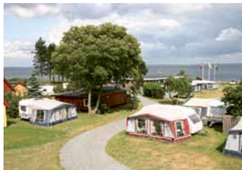
Lundø Camping, 2010. www.lundocamping.dk