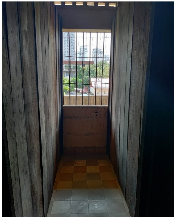
Billede 2:

Modsat Killing-Fields hvor der er flere mindesmærker, og hvor man kan lægge blomster, armbånd eller blot sidde og kigge på mindesmærker, virker S-21 på nogle måder mindre sentimentalt. To ud af tre mindesmærker, som findes på Killing Fields, er ekstrem grufulde, og stedet er ligeså fyldt med død og ødelæggelse som S-21. Men på sin vis opleves Killing-Fields som et mere ærefuldt minde for de døde, fordi den besøgende aktivt kan lægge blomster og armbånd. Herimod fremstår S-21 som et mere statisk kollektivt erindringssted, der formidler de fortidige begivenheder og fortælle ofrenes historie monologisk.