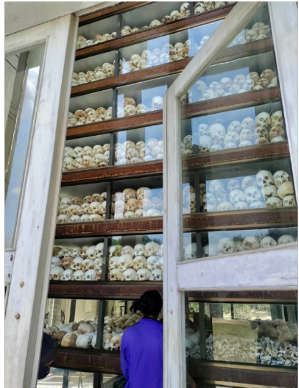
Billede 9: Forfatterens fotografi