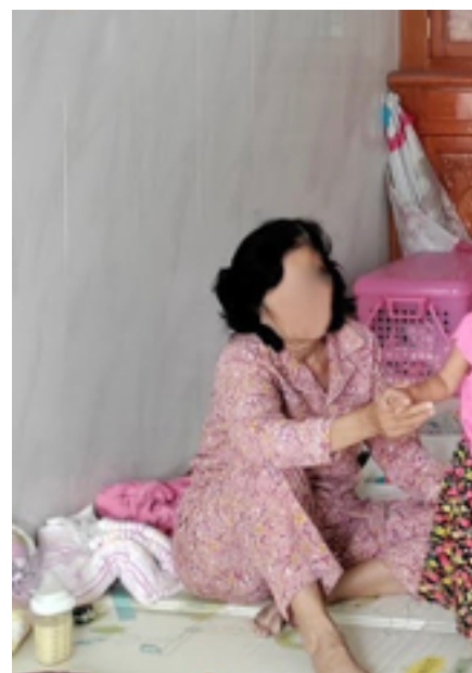
Billede 11: Interviewperson 1.

Vi tog en tuktuk (En taxa, knallert med sidevogn) ud til den første interviewperson. I døråbningen stod en ældre kvinde i en lyserød pyjamas, som var personen vi skulle interviewe. Hun talte ikke engelsk men hilste sødt på os og vi hilste tilbage med en klassisk asiatisk hilsen, hvor man folder hænderne sammen og bukker let. Interviewpersonen er tolkens mor. Interviewet blev foretaget hos tolkens søster, dvs. interviewpersonens anden datter, da interviewpersonen passede dennes barn. Interviewet blev foretaget på gulvet, da det i Cambodja er mere almindeligt at sidde på gulvet på tæpper end i sofaer/på stole. Vi satte os overfor interviewpersonen på gulvtæppet med tolken siddende tættest på hende. Interviewpersonen havde intet problem med at besvare alle spørgsmål og virkede ikke synderligt oprevet. Men vores tolk (hendes datter), fik tårer i øjnene et stykke inde i interviewet, grundet de ekstreme detaljer. Da interviewet var færdigt, gav vi interviewpersonen 12 dollars som tak og tog tilbage for at transskribere interviewet.