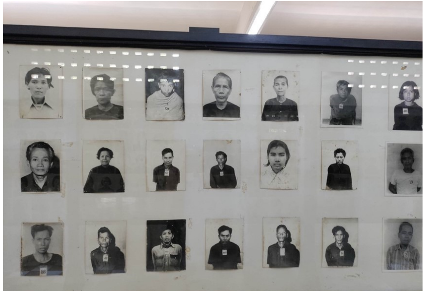
Billede 3: Forfatterens eget fotografi

Museet er også en blanding af overlevende og dødes historier. Man blev præsenteret for billeder af nogle af ofrene og plancher, hvor både de døde og overlevendes livshistorier er beskrevet. Der er båndoptagere, hvor man kan lytte til de overlevendes erindringer, og en mand inde i fængslets gård, der sælger en bog, hvori man kan læse hans personlige erindringer. Dette kollektive erindringssted benytter altså i høj grad individuelle erindringer til at fortælle dets historie. En historie som er bygget op af individuelle erindringer, et fængsel er ikke et fængsel, før det er befolket med mennesker. Så museets fokus på de individuelle erindringer og på at give et personligt ansigt og en historie til de mange mennesker, der mistede livet, giver god mening. Det gør også museumsoplevelsen mere givende. Modsat, hvis man blot havde kunne se cellerne, torturinstrumenterne osv. Med de personlige fortællinger gives mulighed for at høre, læse og se ofrene, giver en følelse af, at man som besøgende kender dem, kan indleve sig i deres situation og får medfølelse med dem. Cellerne ser anderledes ud, når man har set billeder af ofrene og læst om deres barndom. Den elektriske stol virker ekstra grufuld, når der sidder en mand i gården, der har siddet i selv samme stol 40 år tidligere. Så inkluderingen af de øjenvidner og individuelle erindringer giver en effekt, som gør det nemmere at relatere til det kollektive erindringssted og forstå dets historie.