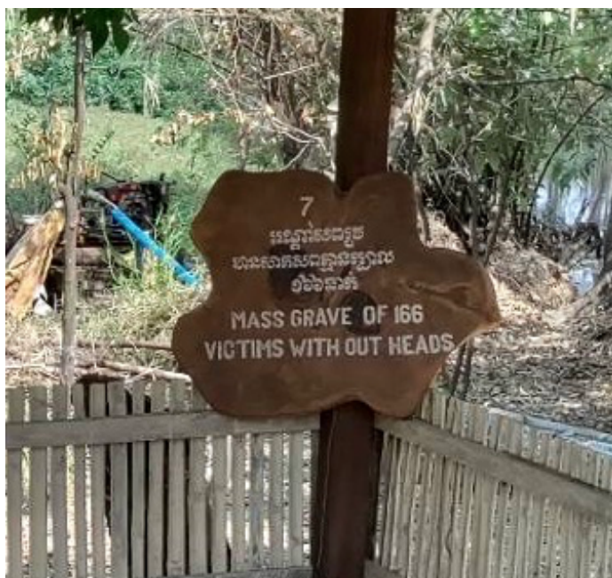
Billede 6:

Det fremgår derfor tydeligt af måden museet og audioturen er opbygget på, at Choeng Ek ønsker at fremhæve fortællingen om dem, der led den smertefulde og makabre død.