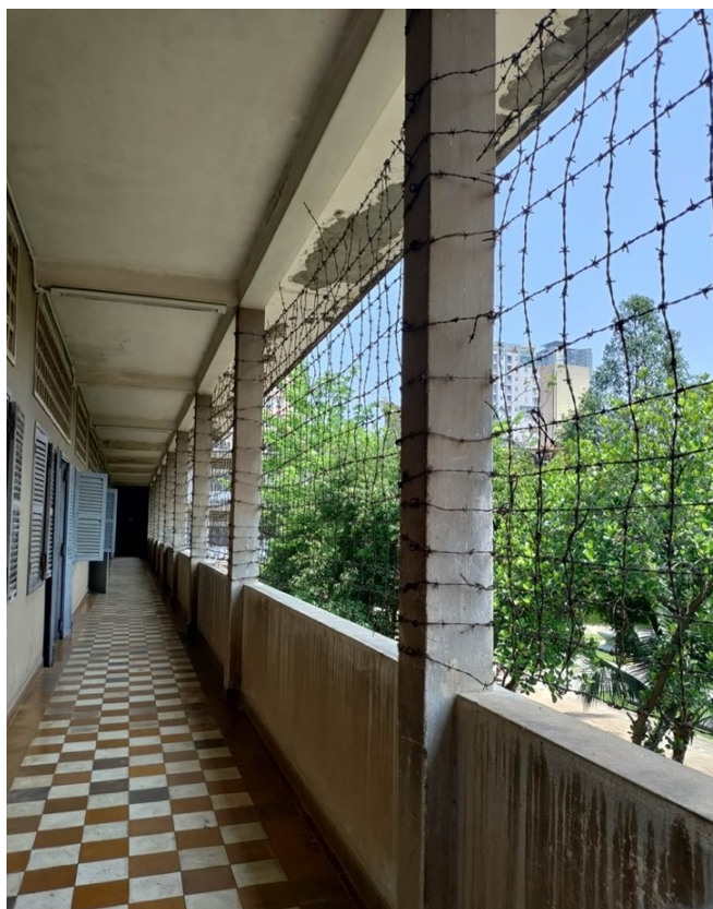
Billede 1: Forfatterens eget fotografi

Tuel Sleng S-21 (forkortet til S-21) var et fængsel/koncentrationslejr der under Khmer Rouge regimet blev benyttet til at få 'fjender af regimet' til at tilstå og angive medsamsvorne. Før Khmer Rouge havde fængslet været en skole. Regimet omdannede klasselokalerne til celler og der blev opsat pigtråd overalt så fangerne ikke kunne flygte eller begå selvmord. I Khmer Rouge periodens tidlige år var de fængslede oftest akademikere eller andre former for 'nye' folk, udlændinge, munke, forhenværende soldater for Lol Not og andre klassiske fjender af Khmer Rouge. Men som tiden gik og Pol Pot og hans inderkreds blev mere og mere paranoide begyndte Khmer Rouge soldater