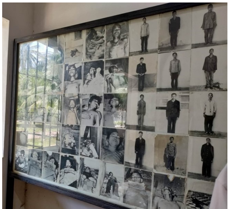
Billede 4: Forfatterens eget fotografi