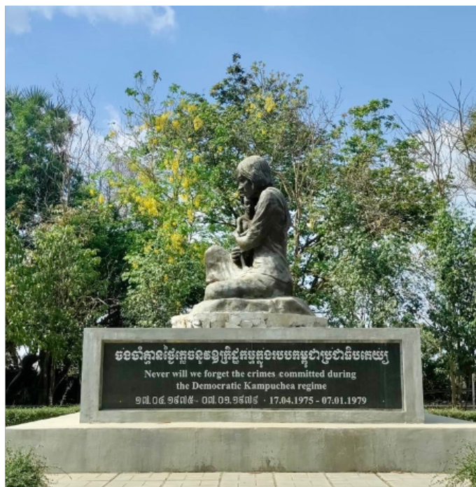
Billede 10: Forfatterens fotografi

Efter gåturen rundt på drabsmarken, kommer man til en stor statue. På toppen sidder en kvinde med sit barn i sine arme. Begge udmarvet og bange. På alle fire sider af statuens fod står der på både khmer og engelsk: Never will we forget the crimes committed during the Democratic Kampuchea regime . Så lige meget hvilken side man ser statuen fra, er beskeden tydelig: det cambodianske samfund vil aldrig glemme Khmer Rouge og rædslerne, de pålagde samfundet. Der behøver ikke at stå mere på statuen, for på dette tidspunkt har man været igennem audioturen. Man har set mængden af ofre og