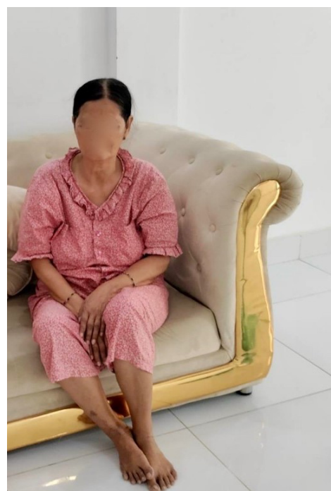
Billede 12: Forfatterens fotografi Interviewperson 1.

Klokken var lidt i 15 og vi skulle til at gå over til vores anden interviewperson, der boede tæt på, hvor vi opholdt os. Det var en varm eftermiddag, 30 grader, solen skinnede og vi kunne høre børn lege og grine ude på gaden. Da vi skulle til at gå, fortalte vores tolk, at det alligevel ikke var muligt at afholde interviewet hjemme hos interviewpersonen, og at interviewet derfor blev flyttet til der, hvor vi opholdt os. Interviewpersonen og tolken kendte hinanden godt, idet de boede på samme gade. Af den grund vurderede vi, at det stadigvæk et trygt nok rum for interviewpersonen at fortælle sine erindringer i. Interviewpersonen var en ældre kvinde, klædt i et lyserødt nattøjssæt, med håret pænt sat op. Vi hilste på hende, takkede hende for at hun ville tale med os og satte os ved siden af hende i sofaen.