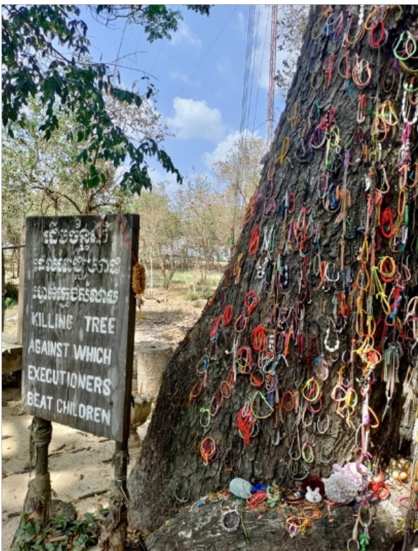
Billede 8: Forfatterens fotografi