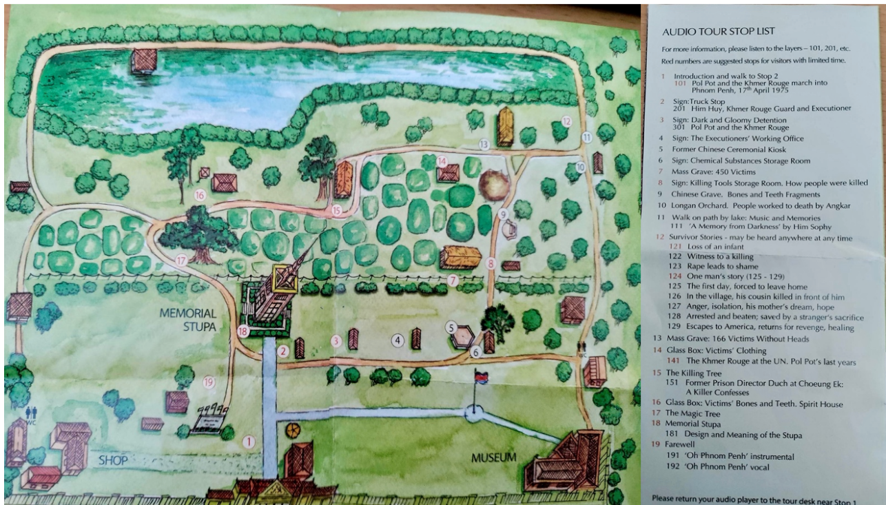
Billede 7: Forfatterens fotografi af brochuren fra Choeng Ek. Kort og liste over stops under audioturen ved Choeng Ek