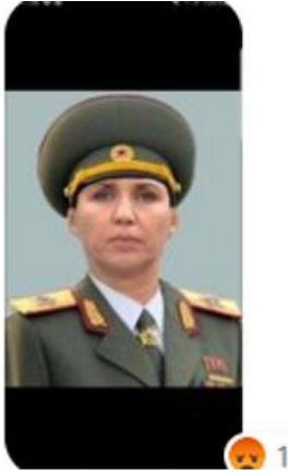
(Bilag 4: L. 2283-2285)