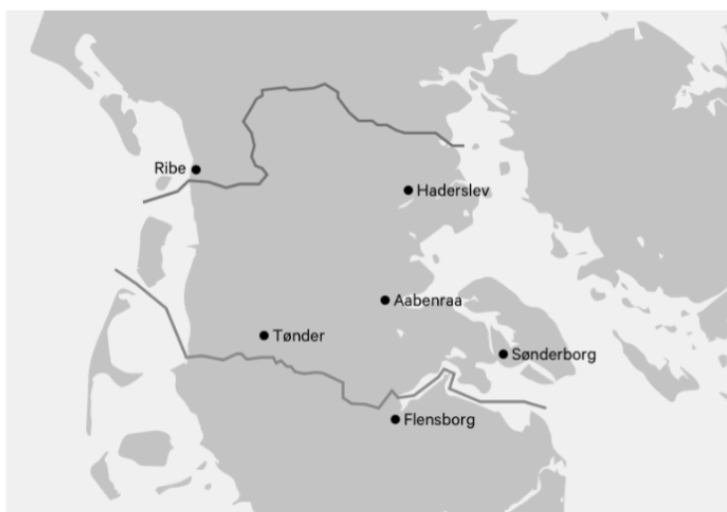
Kort 3: På kortet ses den nordlige grænse, som blev trukket efter nederlaget i 1864 og den efterfølgende sydlige grænse, som blev en realitet efter afstemningen i 1920.

Resultaterne af de to afstemninger resulterede i, at grænsen mellem Danmark og Tyskland blev rykket mod syd. På kortet herunder viser den nordlige streg grænsen før afstemningen og den sydlige streg udgør grænsen efter afstemningen - omtrent den grænse vi har i dag.