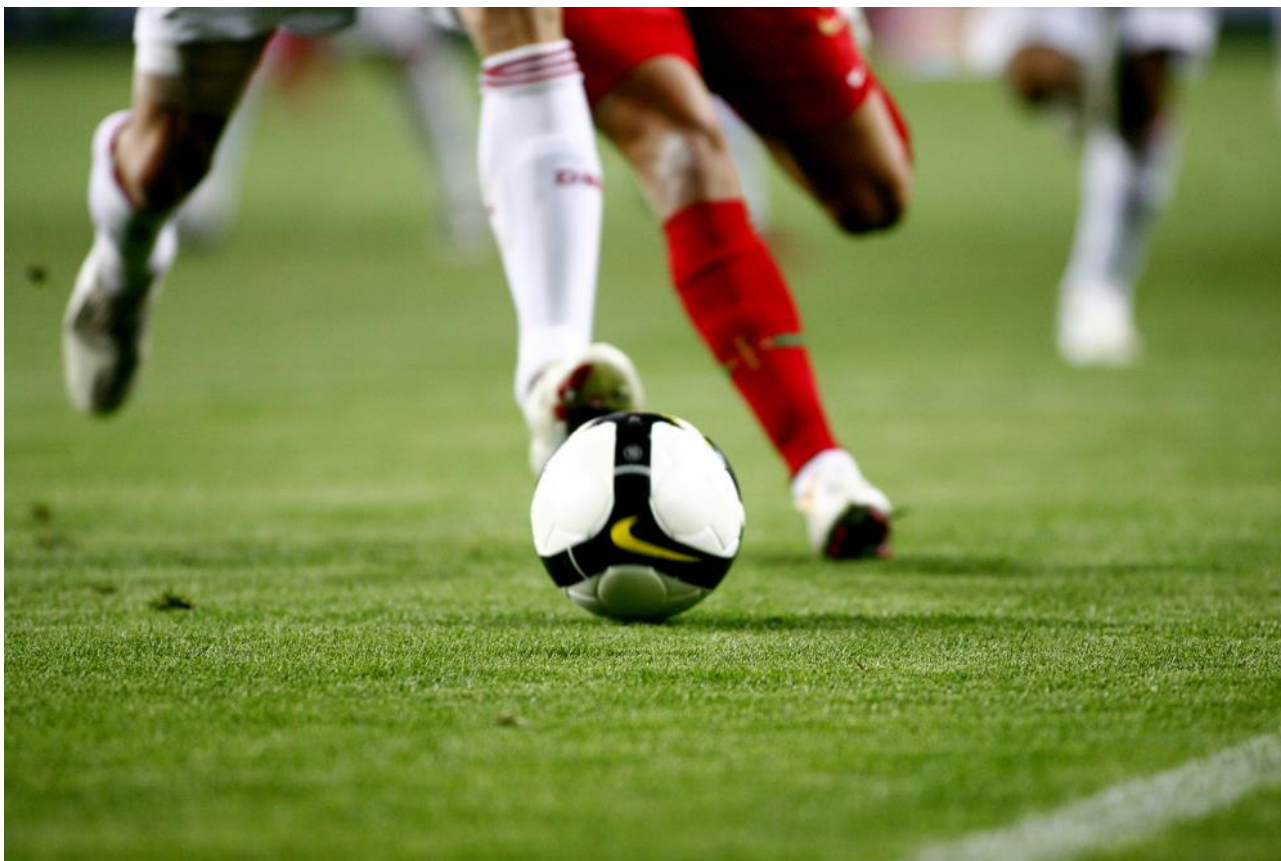
Det bliver på hjemmebane, når Danmark skal spille EM.