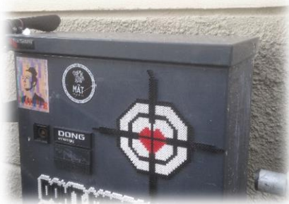
Billede 4: Perlegraffiti på Krusågade

udførelsen af aktionen. Nogle af de lokale beboere følte, at de ikke var blevet inkluderet i processen, og at den blev ført hen over hovedet på dem. Oplevelsen af den manglende inklusion blev forstærket ved, at der var udefrakommende kunstnere, der deltog i processen, da det derved ikke følte som et lokalt projekt (Douglas, 2018: 116). Udover at belyse, at den lokale borgerinklusion er vigtig i udviklingsprocesser, illustrerer eksemplet, at der i de avantgardistiske DIY-urbane praksisser er et fokus på at ændre eller løfte et områdes omdømme. Andre eksempler på det er at omdanne en telefonboks til bogreol eller male en grå trappepassage i det offentlige rum (eksempler beskrevet i henholdsvis Douglas, 2014: 12 og Fabian og Samson, 2016: 168).