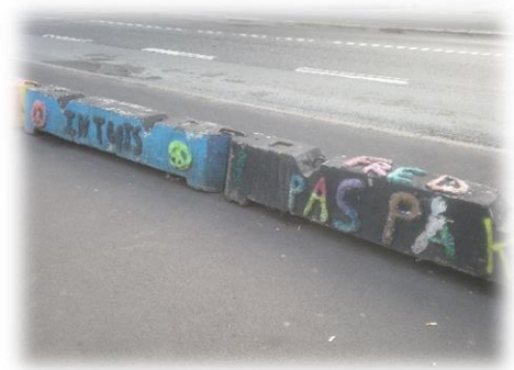
Billede 1: DIY-kunst på afspærringsklodser

Dette projekt udspringer af en interesse for borgernes forskellige måder at tilegne sig byen på. Det ses i forskellige sammenhænge, at borgere i samarbejde med eller uden involvering fra planmyndigheder vælger aktivt at deltage i at forme byen. Fra mindre tiltag som at dekorere skilte eller opsætte kunst på bygningsfacader og over til større tiltag som at organisere urbane haver eller på anden vis indrette sig på ubrugte områder. Disse tiltag og måder at indrette sig på er interessante, da de taler ind i en måde at føre byplanlægning på umiddelbart uafhængigt af den offentlige planlægning. Hvorfor nogle folk som enkeltindivider eller i grupper vælger aktivt at præge byen, og hvordan det kan blive forstået ind i den nutidige byudvikling, er centrale spørgsmål her.