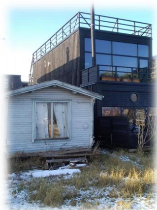
Billede 6: Fiskerhavnen

Efter det mislykkedes at gennemføre planerne om boligbyggeri på Amager Fælled, Strandengen 17 (Ørestad Fælled Kvarter), besluttede et flertal i Københavns Kommunes borgerrepræsentation i forbindelse med