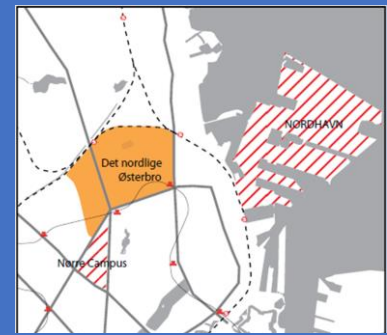
Faktaboks 8: Skt. Kjelds Kvarter og tilhørende områdefornyelse (Byens Fysik, 2011: 6, 10).

Områdefornyelsens budget var 60 mio. kr., og fornyelsen blev igangsat i 2011 for at ændre området fra et nedslidt boligområde.