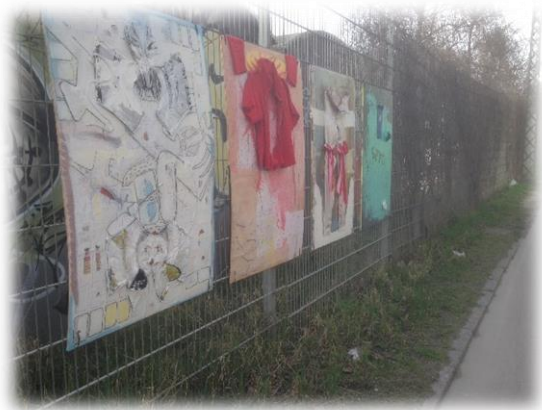
Billede 3: DIY-kunst på Ingerslevsgade

De avantgardistiske praksisser illustrerer nogle af de interessekonflikter, der kan være i det DIY-urbane felt, hvor det, som den ene part finder pænt eller relevant, måske ikke falder i god jord hos den anden. Dette kan