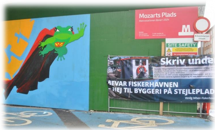
Billede 7: Supertudsen på Mozarts Plads (FiskerhavnenVenner, Facebook).

Her har man blandt andet inviteret politikere