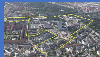
Faktaboks 9: Kort beskrivelse af bykvarteret Carlsberg Byen (Byens Udvikling [a], 2016 [2009]: 5).

Carlsberg Byen ligger på grænsen mellem Vesterbro og Valby i København og er et af hovedstadens nye bykvarterer. Området har sin egen S-togsstation og består af blandt andet boligbyggeri, uddannelsesinstitutioner og butiksliv.