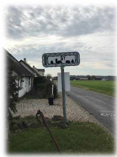
Billede 2: DIY-skilt i Fjellebroen. Opsat for at indikere, at det er et byområde.