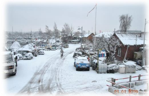
Billede 5: Fiskerhavnen.

Det bliver i Grindsted et al. (2018) beskrevet, hvordan “anlægsarbejdet blev iværksat for at undgå tysk deportation af arbejdsløse til den tyske krigsindustri” (Grindsted et al., 2018: 203). I 1943 blev havnen taget i brug af lystsejlere, og i 1948 flyttede garnfiskerne, der tidligere havde ophold sig på Djævløen, derhen (ibid.: 203). Det har siden da været et sted for