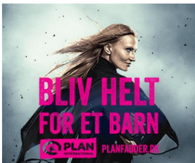
(Plan Danmark - Bliv helt for et barn)

At danskere skal være “helte”, der “redder” andre er også et budskab som PlanFadder har kørt på. I 2017 lancerede de kampagnen: “Bliv helt for et barn” og nedenstående plakat hang på de fleste busstoppesteder rundt om i landet.