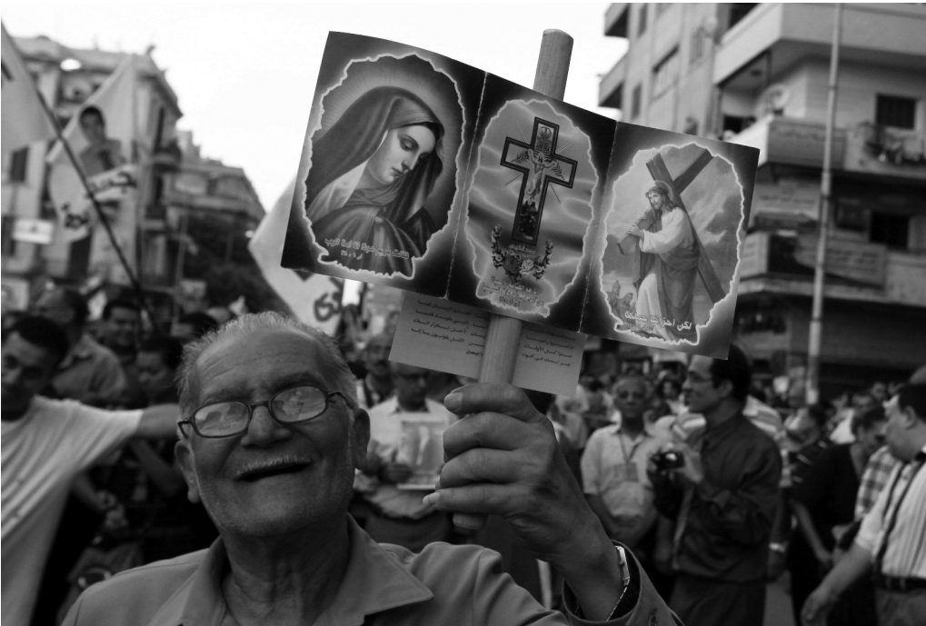
Koptere protesterede da en bombe kort tid før januar-protesterne dræbte 21 personer ved en koptisk-ortodoks kirke i Aleksandria.

magten og deraf skiftende politiske regimer. Ikke overraskende blev kopterne som et religiøst mindretal klemte i de magtkampe, der fulgte efter 2011-revolutionen, hvor ikke mindst islams betydning for det at være egypter blev et centralt tema. Det tvang koptere til at navigere i et konfliktfyldt politisk felt, hvor deres position som egyptere og kristne kom under angreb. Fra at have stået som inkluderede medlemmer af den folkelige majoritet på Tahrir, måtte de se sig minoriserede i kampene om at definere en ny egyptisk identitet.