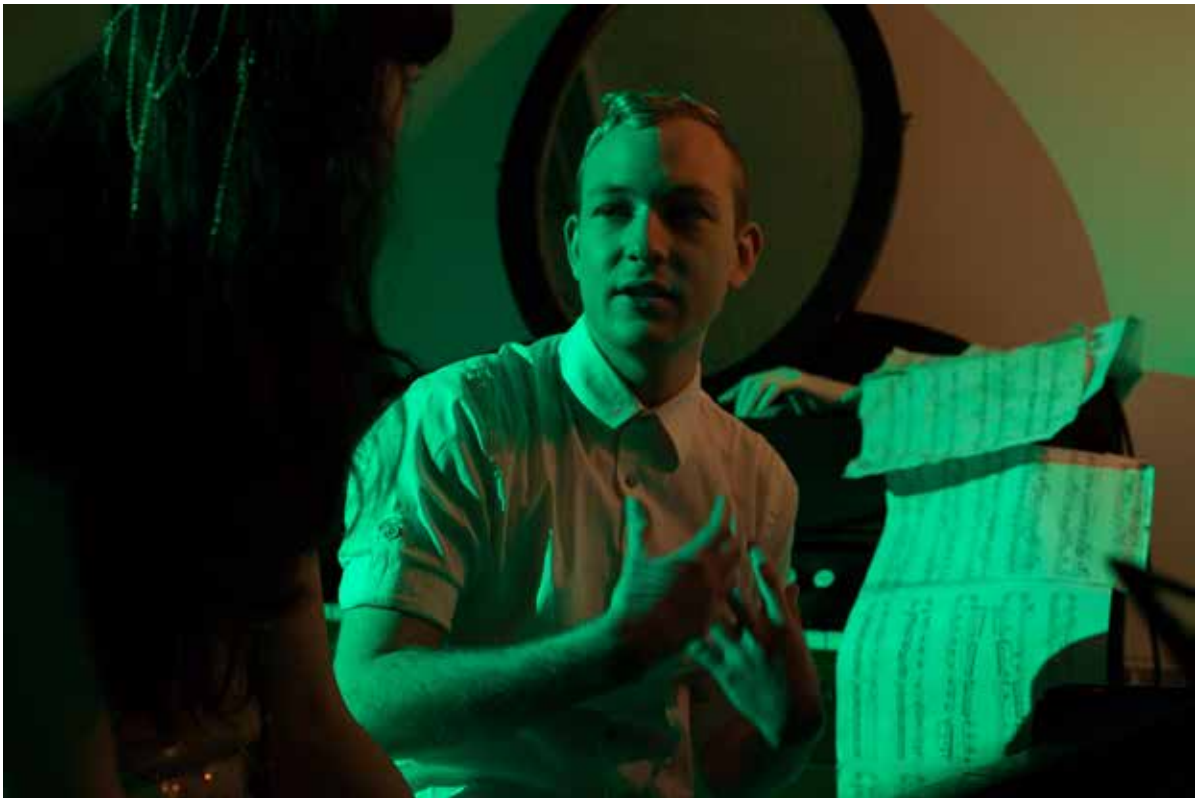
En elev i samtale med The Chain Hands Pianist.