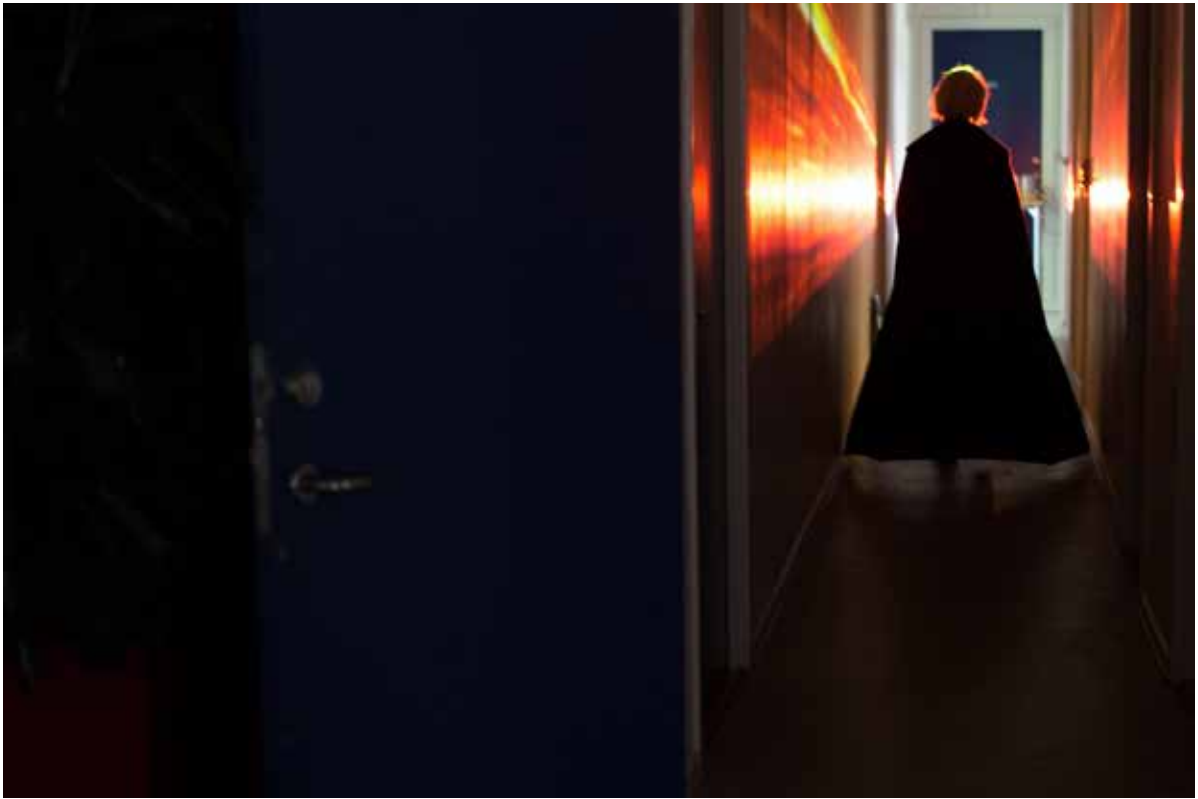
En lærer bevæger sig ned ad en gang på Sisters Academy #01.