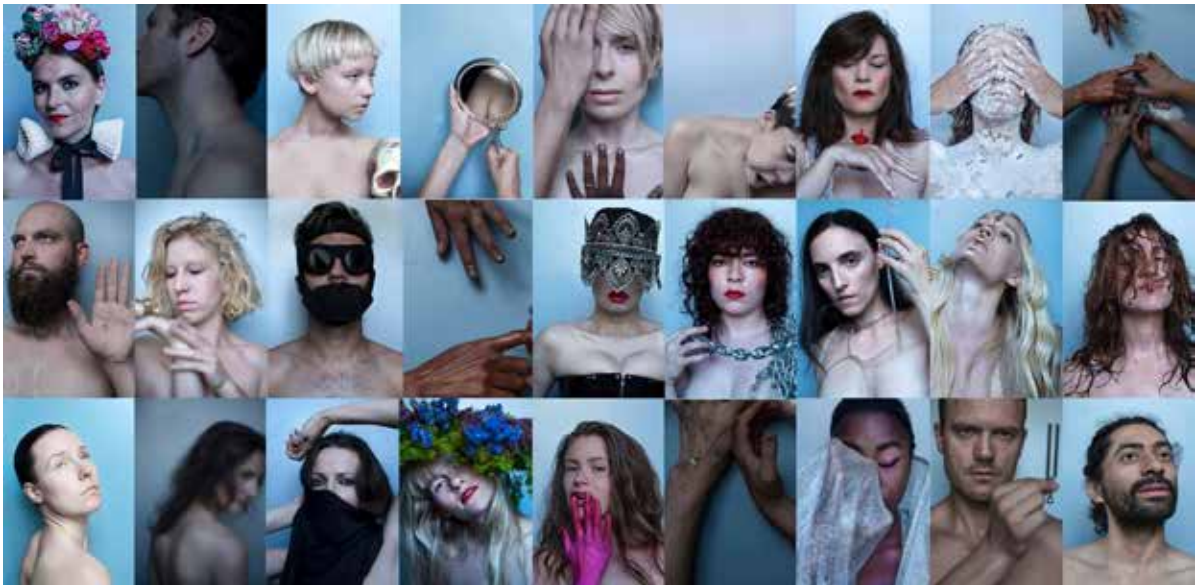
Sisters staff. Poetiske portrætter forud for Sisters Academy #3, Sverige – The Boarding School manifesteredes på Inkonst.

At påtage mig et »poetisk selv« forekommer ofte frigørende. Uden at blinke med øjnene kan The Sister , The Ambassadors Wife eller The Fiction Pimp fremsige store og radikale visioner. Det hører det poetiskes væsen til. Jeg vil nu give ordet til mit poetiske selv – The Sister . Fra denne udsigelsesposition vil jeg dele Sensuous Society-manifestet, som også er baggrunden for kunst- og læringsprojektet Sisters Academy , som denne artikel omhandler. I Sisters Academy oversætter vi kritikken til en praksis, hvor vi afprøver alternative tilgange til væren, samvær og læring gennem den fysiske deltagelse i en radikalt anderledes verden.