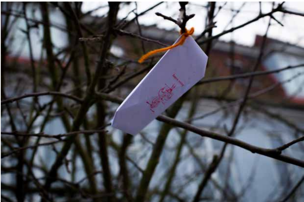
Breve fra besøgene på Åbent hus-dagen d. 28.2. Her blev de efter besøget bedt om at skrive deres håb, drømme og konkrete forslag til fremtidens uddannelsessystem ned. Brevene blev hængt på et træ i skolegården. Efterfølgende blev brevene indsamlet og indgår i de data, der i øjeblikket bearbejdes fra Sisters Academy #01.