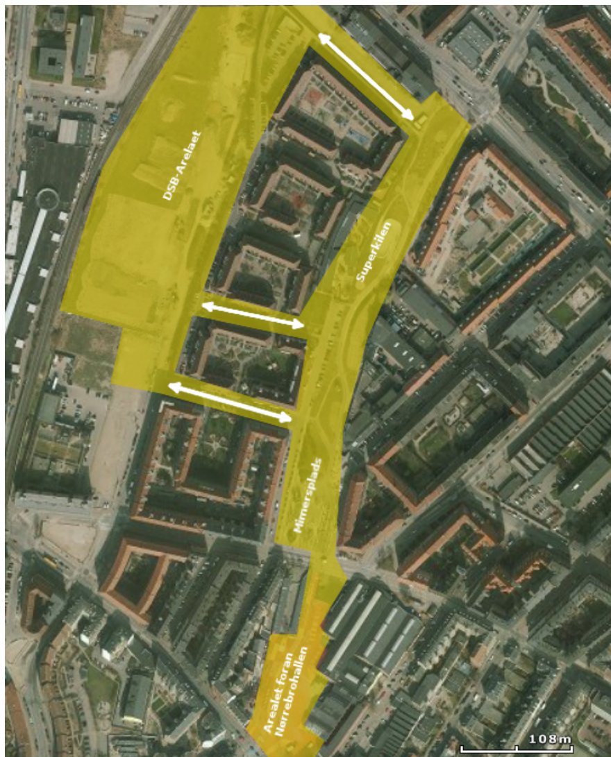
Kort 1: Den gule markering på kortet, viser det byrumsområde som skulle fornyes i samarbejde med Realdania. I planerne bliver arealet foran Nørrebrohallen, Mimers Plads, DSB-arealet og Superkilen ('den grønne kile') nævnt som tre separate projekter. Mjølnerparken består af de tre karéer mellem Superkilen og DSB-arealet, og de tre pile illustrerer de passageveje man ville etablere, for bedre at implementere Mjølnerparken i byrumsfornyelsen.

Projektet skulle vise nye veje, for en fornyet og styrket integrationsindsats og for værdibaseret byfornyelse i nedslidte bykvarterer (Rambøll 2005: 5). Denne målsætning skulle nås ved at etablere og videreføre det rekreative stræk, i et sammenhængende forløb fra Nørrebroparken via udearealet foran Nørrebrohallen, 'den grønne kile' 20 , passagevejene ved Mjølnerparken og DSB-arealet mod Lersøparken og Rentemestervej kvarteret (se Kort 1) (Rambøll 2005: 6).