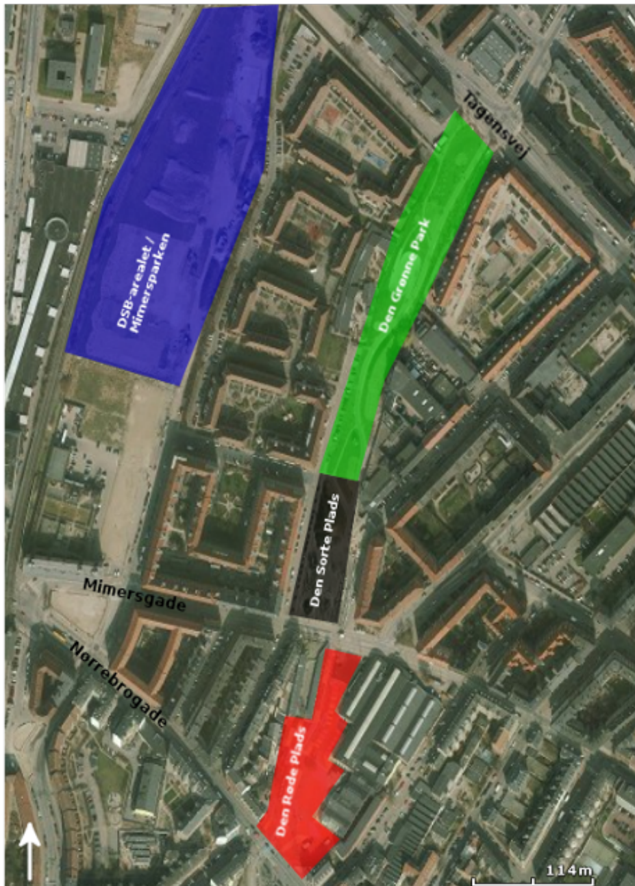
Kort 2: Dette kort viser hhv. Den Røde Plads (markeret med rødt), Den Sorte Plads (markeret med sort), Den Grønne Park (markeret med grøn), det gamle DSB-areal som nu er omdannet til Mimersparken samt de tre store veje der løber imellem Superkilens byrum.

Med den indledende analyse fra Rambøll, som ramme for projektet, begyndte rådgiverteamet at udarbejde en mere præcis formulering for Superkilen. Rådgiverteamet tog udgangspunkt i Rambølls anbefaling om særligt at medtænke beboere af anden etniske herkomst, da der jo blev peget på, at denne gruppe var særlig udsat. Gennem en optælling fandt man frem til, at der var over 57