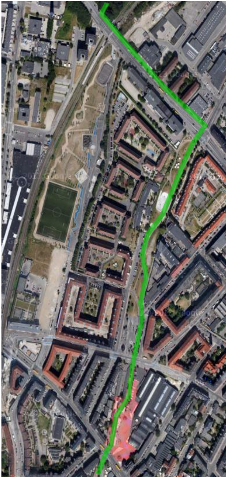
Kort 4: Viser Den Grønne Cykelsti igennem Superkilen. Cykelstien er markeret med grønt.