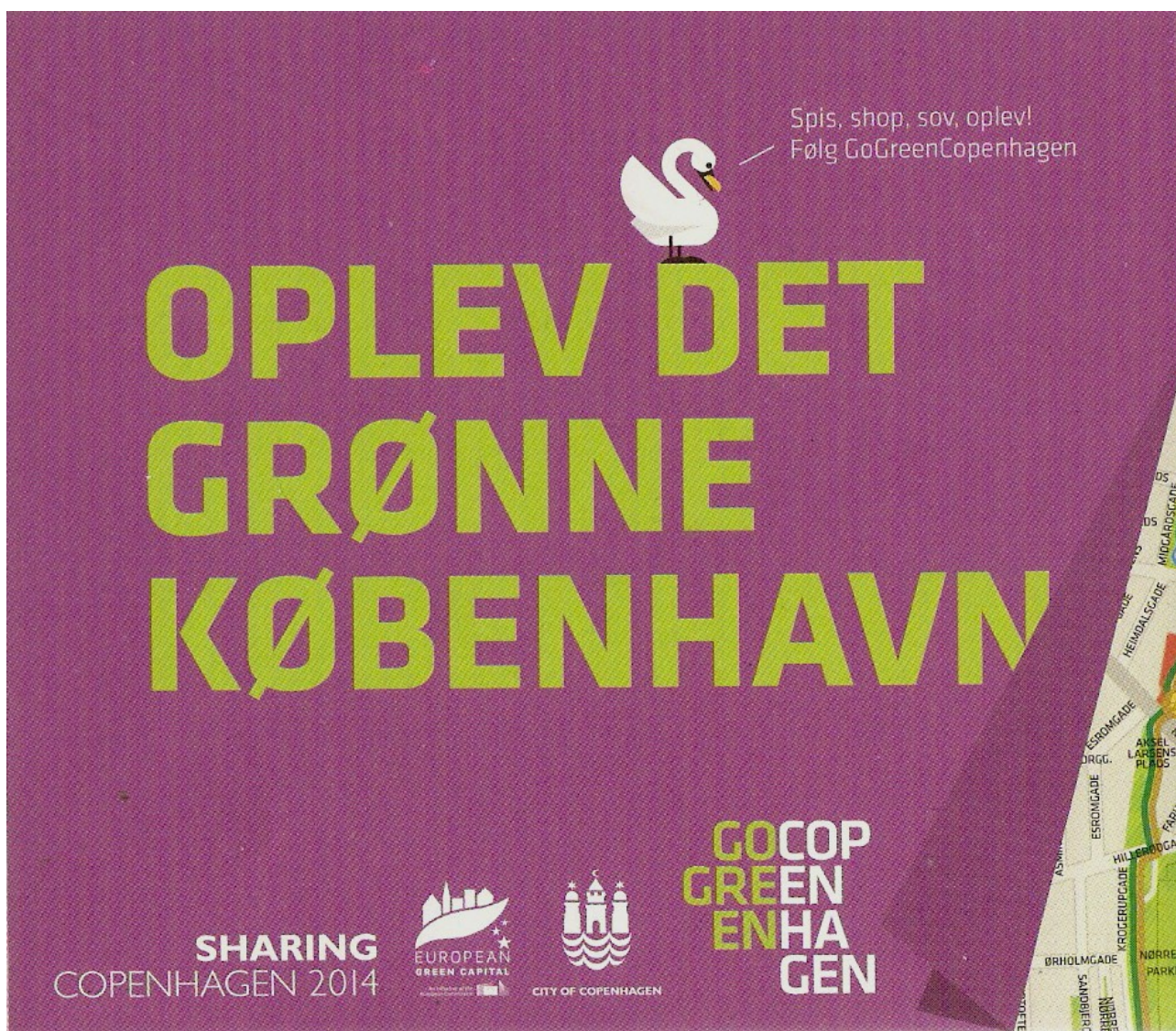
Tekst 1: Kortets forside i sammenfoldet tilstand

Teksterne er indscanninger af udvalgte dele af Go Green Copenhagens fysiske bykort fra 2014.