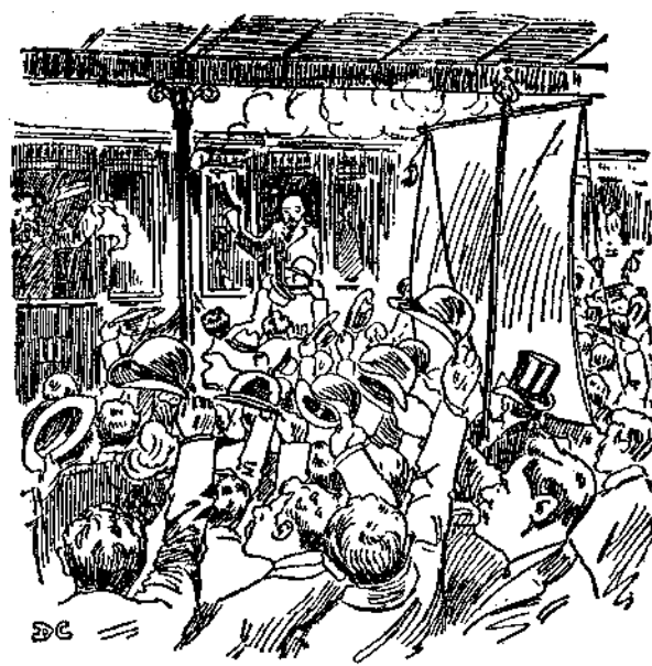
De russiske Socialdemokrater hvides paa Esbjerg Banegaard.