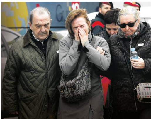
BT: forsidebillede 25.marts 2015