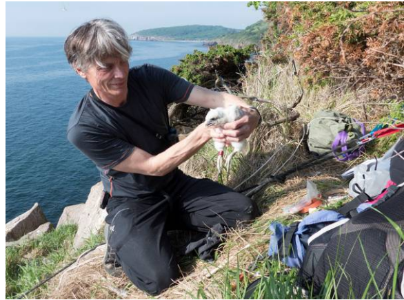
Mærkning ved Mulekleven, Bornholm