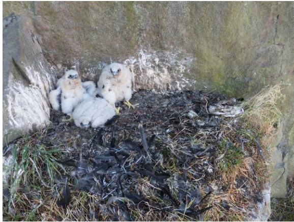
Ungerne på redehylden i Stubbeløkken, Bornholm, havde fået meget varieret føde – inklusive Solsort, Allike (juv), Sølvmåge (både juv. og ad).