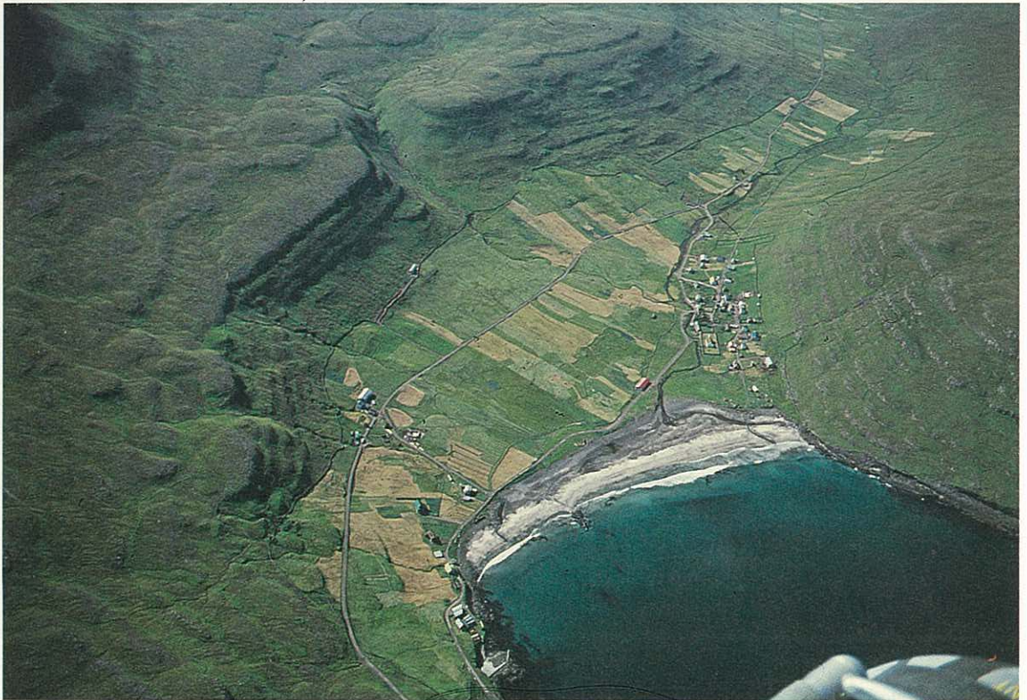
Fig. 7. Bygden Húsavík på Sandoy. En nærmere beskrivelse af bygden findes i »topografisk Atlas Danmark«. En beskrivelse af fårebruget findes i »Om økologi«. En beskrivelse af bygdens økonomiske forhold findes i »Noget om bygden Húsavík«. Se litteraturlisten.

Samtidig betød netop monopolhandelen, at forbindelsen til omverdenen ganske kanaliseredes gennem denne, idet det var forbudt at handle med fremmede. En sådan handel var dog gangse udbredt, når man