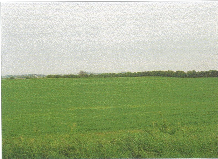
Figur 1. Ophør af et regelmæssigt sædskifte, forøgelse af markstørrelse og ensidig satsning især på korn til svinefoder førte i 1970'erne til at over halvdelen af landbrugsarealet blev dækket med store ensartede flader af vårbyg. Møn, 1996.

På baggrund af feltarbejde gennemført først i 13 små områder i Østdanmark, senere i 32 områder repræsentativt fordelt over hele landet, lykkedes det at kortlægge den aktuelle dynamik i småbiotopudviklingen. Også dens sammenhæng med landbrugets teknologiske og strukturelle udvikling blev belyst gennem interview med landmændene i de 32 områder. Kortlægningen er foretaget hvert 5 år fra 1981 til 1996. Der er endvidere foretaget overflyvninger med flyfotooptagelser af alle områder i 2001, og i forbindelse med det nye nationale naturovervåg-