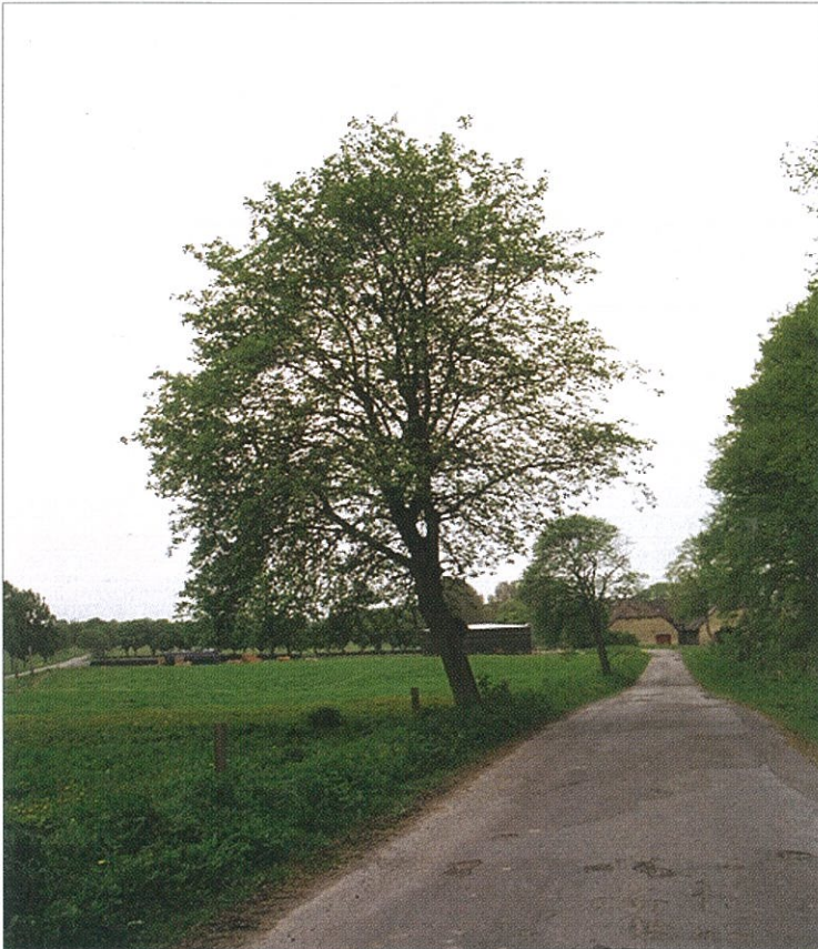
Figur 3. Et større enkeltstående træ midt på en mark vil såvel ud fra et militært som et landskabsforvaltningsmæssigt synspunkt blive registreret ved en topografisk kortlægning, selv om dets areelle udstrækning er ganske lille. Men står det som her langs en vej, vil det ofte blive betragtet anderledes, og der vil være en tilbøjelighed til ikke at regne det med, da det alligevel betragtes som for ubetydeligt i den givne målestok. Møn 1996.

Men funktion er naturligvis altid afgørende i et anvendelsesperspektiv, og der er her ofte væsentlige forskelle på de funktioner kortbladens oplysninger om småbiotoperne har for vore dages forvaltning af det åbne land og de funktioner de havde for den forvaltning, der i sin tid udarbejdede kortbladene.