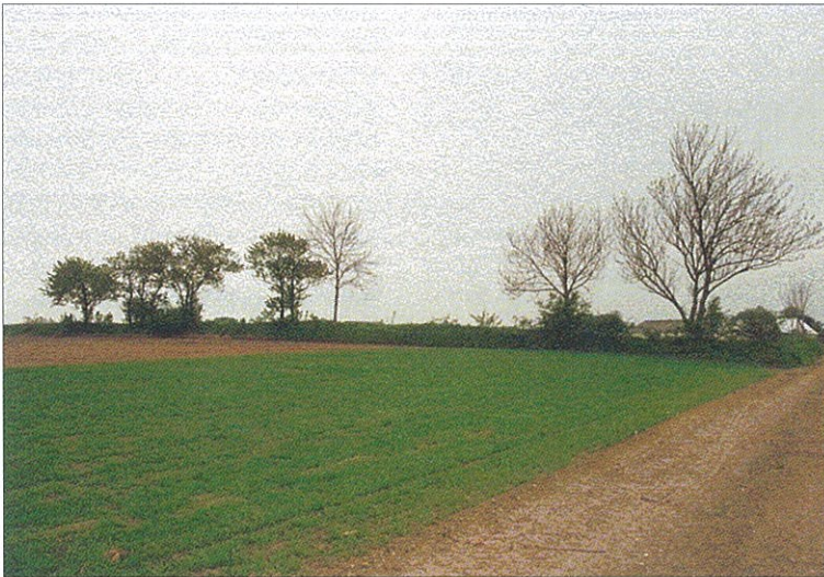
Figur 4. Er det et skel, et dige, et hegn, en træække, eller en kombination? Det er i høj grad et definitionsspørgsmål. På målebordsbladene kunne det være en træække, defineret som 'hegn med huller i', som derfor kunne passeres og som man ikke umiddelbart kunne bevæge sig bagved uden at blive set. Møn, 1996.

Signaturerne for risgærder og ståltrådshegn optrådte stadig på signaturplanen fra 1940, men det ser i praksis ikke ud til at man har udnyttet den ret meget i det åbne land. Det skyldes formentlig, at det i revisionsbestemmelserne allerede i 1924 blev indføjet, at "Ståltrådshegn, risgærder og lægtehegn tegnes kun, når de har afgjort permanent karakter (om dyrehaver, stations-