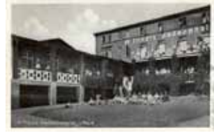
Flindts Badehotel i Lohals, 1932.

ralinden, som hun kender fra København og siger til hende, mens hun ser på de dansende: "Hvor det egentlig er underligt at sidde og se paa alle de Mennesker, som ikke hører os til, det er dog altid som at være paa Komædie."