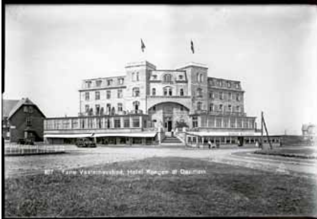
Fanø Vesterhavsbad, Hotel Kongen af Danmark.

pludselig blev badestedet et tysk foretagende. I 1892 blev Kurhotellet indviet, og det var indrettet efter datidens internationale hotelstil med læseværelser og en stor spisesal. Snart efter blev Strandhotellet og Hotel Kongen af Danmark indviet, ligesom der blev opført overdådige villaer i nærheden. A/S Nordsøbadet ejede Kurhotellet, mens de to andre hoteller og villaerne var på danske hænder, ikke desto mindre måtte de indordne sig under aktieselskabets direktion.