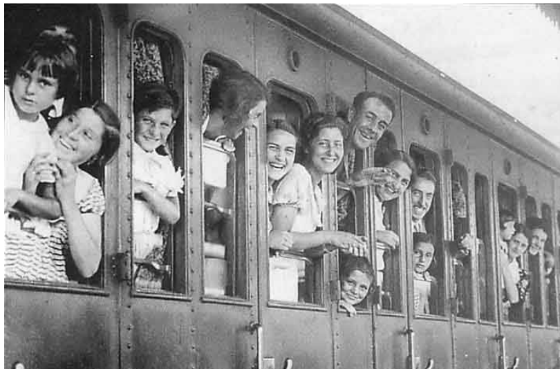
Les premiers congés payés de 1936.

mange tyskere og østrigere tilsluttede sig nazismen, er Kraft durch Freude måske et af svarene. Mellem 1934 og 1939 stod KdF-Reisen for syv millioner selskabsrejser, hvilket gjorde det til verdens største rejsebureau. 20