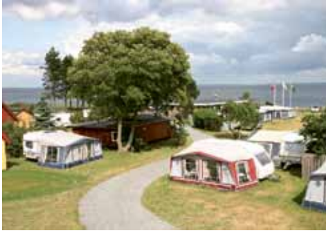
Lundø Camping, 2010. www.lundoe camping.dk