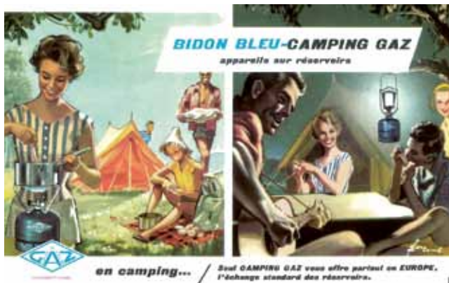
Reklame for campinggas, 1950'erne.

omdannet til Jugendherberger. I Borggaarden paa Stahleck ved Rhinen leger Hitlerdrene i deres praktiske Uniformer." Det gør de sandelig også, og det hele ser meget tilforladeligt ud.