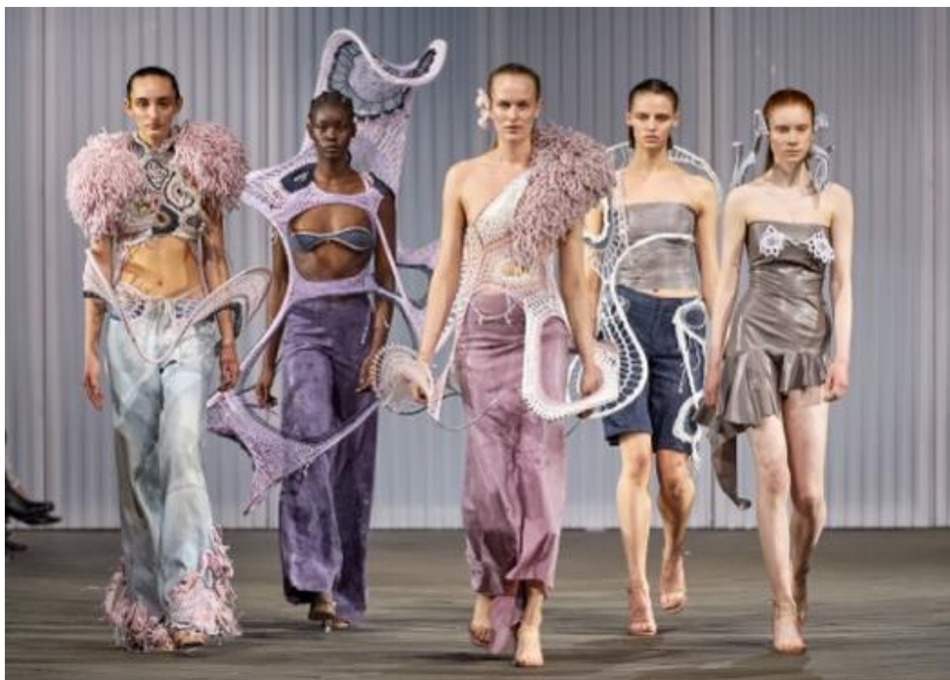
Modeller går til Alphas modeshow ved CPH Fashion Week 2024.